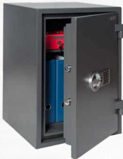
Palermo 3 elo